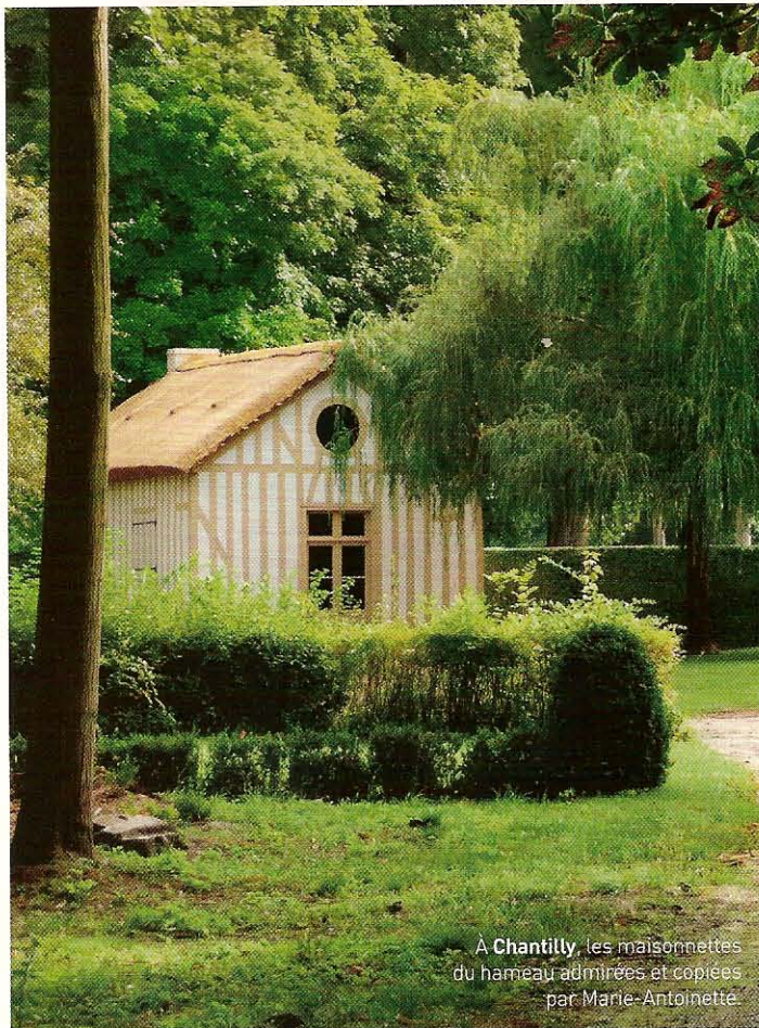
À Chantilly, les maisonnettes du hameau admirées et copiées par Marie-Antoinette.